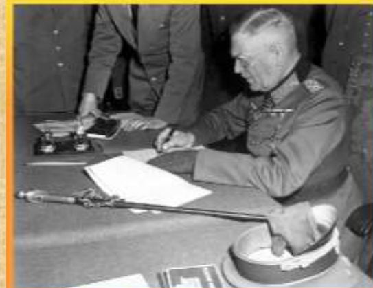
В. Кейтель подписывает Акт о безоговорочной капитуляции Германии

В ночь с 8 на 9 мая в Карлсхорсте был подписан акт о военной капитуляции. Война закончилась.