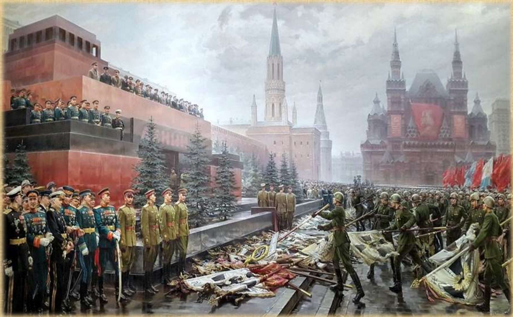
«Триумф победившей Родины» М. Хмелько