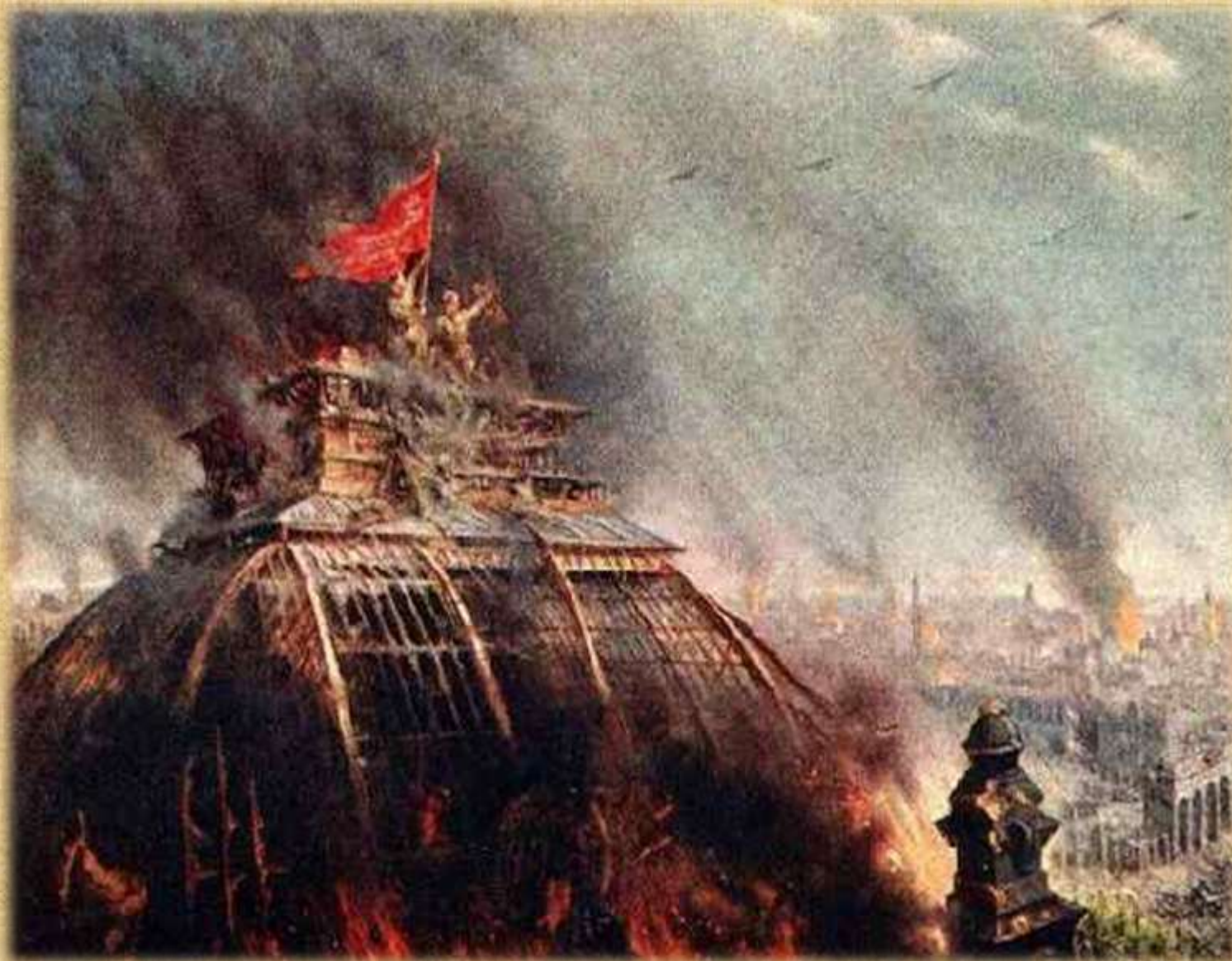
«Знамя Победы над Рейхстагом» Так изобразил Победу художник Владимир Таутиев.