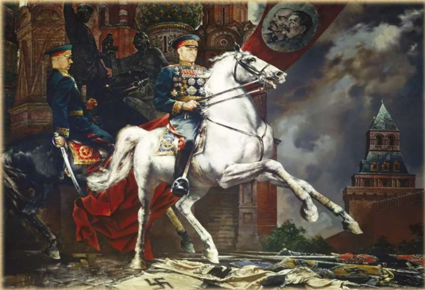
«Парад Победы» С. Присекин