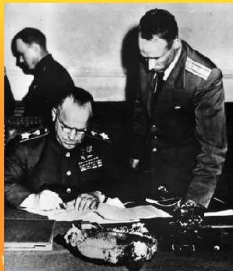
Г.К. Жуков подписывает Акт о безоговорочной капитуляции Германии

Главкомандующий Французской армией генерал ДЕЛАТР де ТАССИНЬ