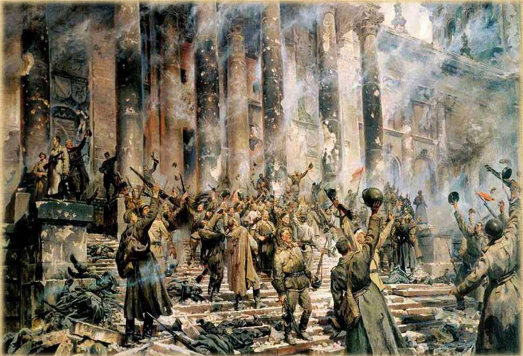
«Победа» П. Кривоногов